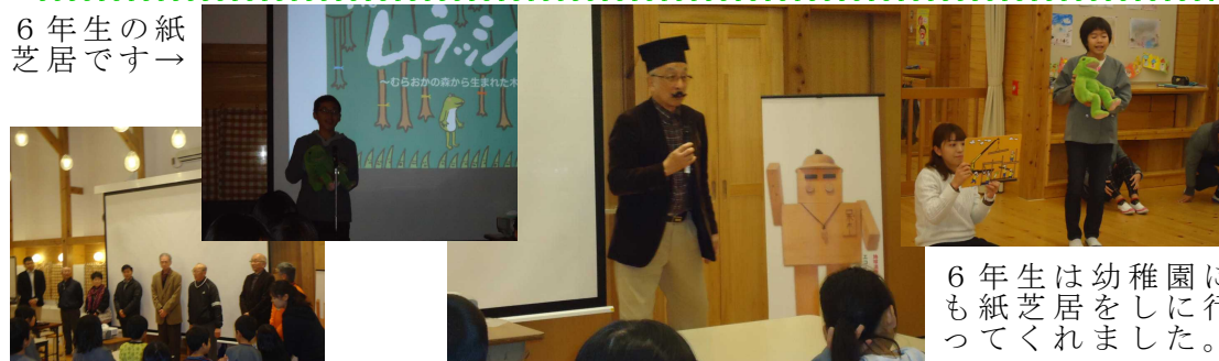
6年生は幼稚園にも紙芝居をしに行ってくれました。