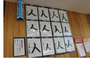
3年・初めての習字