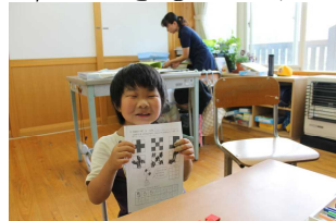
井上学級・形作り