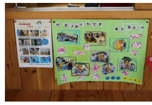
2生・かいせい君との交流