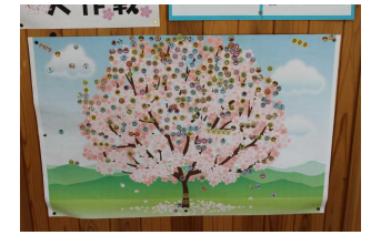
全校生・おはなし大作戦